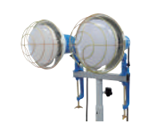
LED投光器・白熱投光器