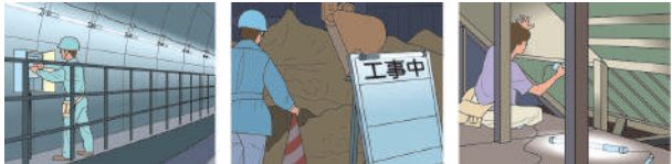
トンネル・地下道などでの使用。 工事現場での使用。 機材が持ち込めない所での使用。