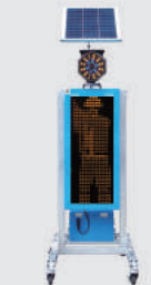
ソーラー式 LED電光盤 (アンバー1文字3段)