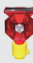
ソーラー式 セフティー フラッシュ (KSF-3SN)