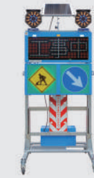
ソーラー式 LED電光盤 (フルカラー3文字1段)