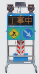
ソーラー式 LED電光盤 (アンバー3文字1段)