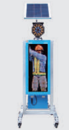
ソーラー式 LED電光盤 (フルカラー1文字3段)