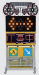
ソーラー式 LED電光盤 (フルカラー6文字2段)