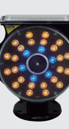
スプレnder G III