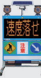
ソーラー式 LED電光盤 (アンバー4文字2段)