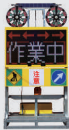
ソーラー式 LED電光盤 (フルカラー5文字3段)