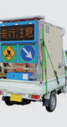
トイレカー用 ソーラー式 LED電光盤 (アンバー3文字1段)