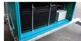
100Ahの大型バッテリーを搭載。