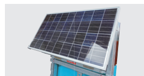
100Wのソーラーパネル使用。 無日照約7日間。