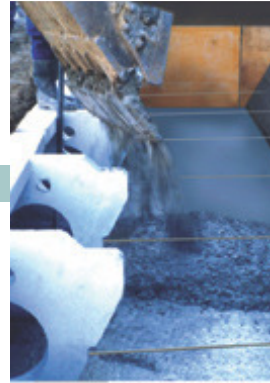
7] 胴込・裏込コンクリートの打設