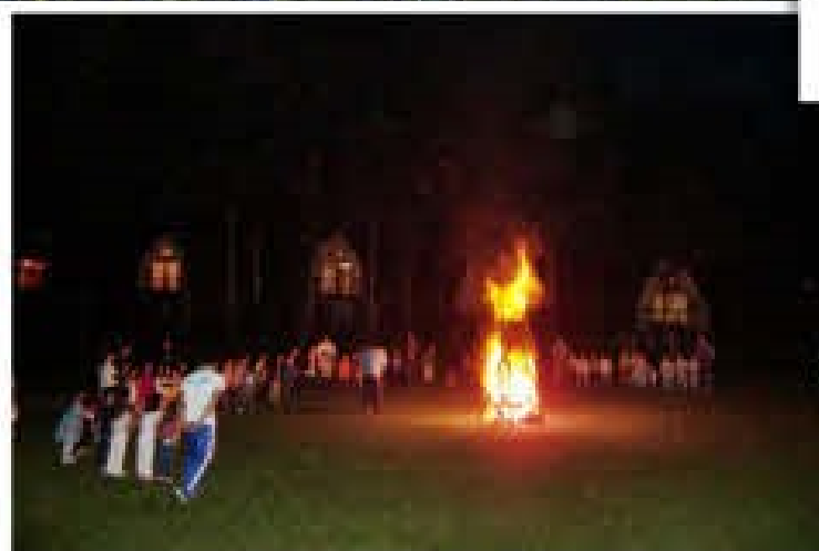
キャンプファイヤー「バンバン踊り！最高」