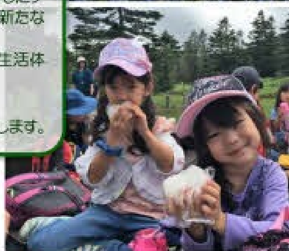
北八ヶ岳トレッキング「おにぎり、おい