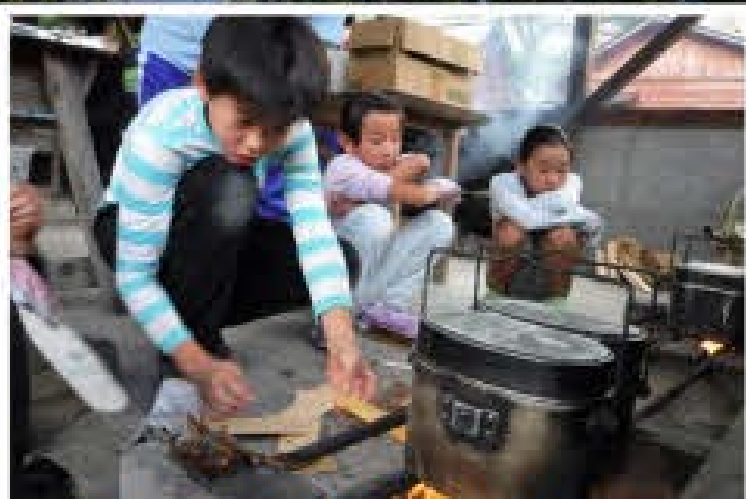
飯盒炊飯「はじめての炊飯、お力になって」