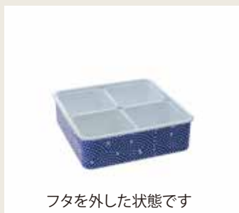
フタを外した状態です

入 数：36/ct・1ヶ袋入 サイズ：189×189×60Hmm 材 質：(本体) ポリプロピレン (フタ) ポリプロピレン (中子) ポリプロピレン