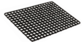
導電メッシュマット