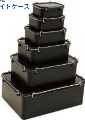
導電 タイトケース