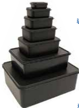
導電パーツボックス