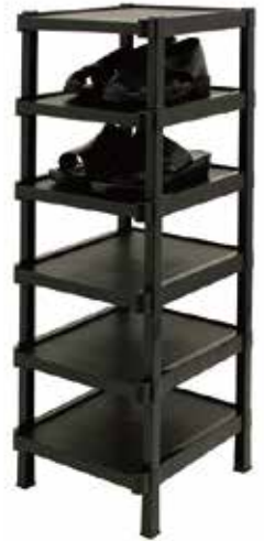
導電スリッパラック6段