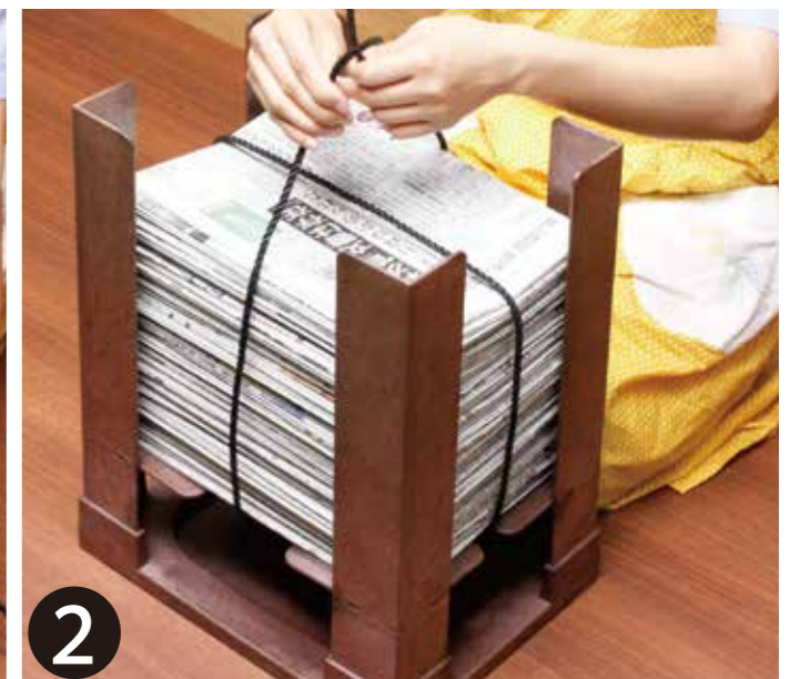
② 下でクロスさせ、ひもを上まで持っていきます。