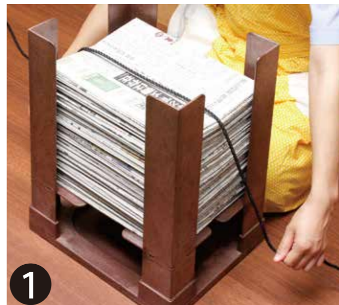
① 上からひもをかけます。