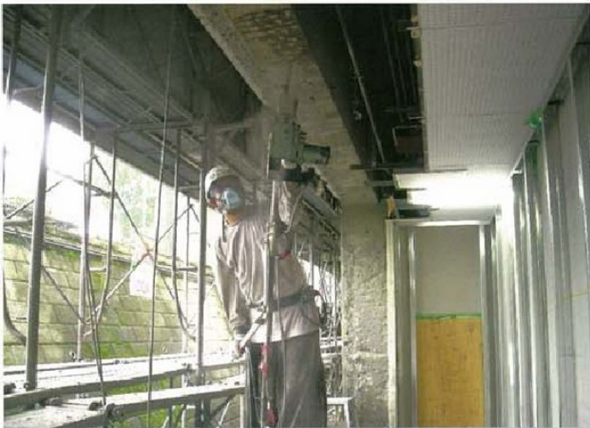
熟練のスタッフが耐震工事を担当します。