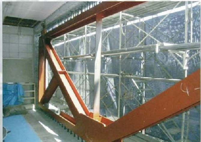
建物に安心と安全をお約束いたします。