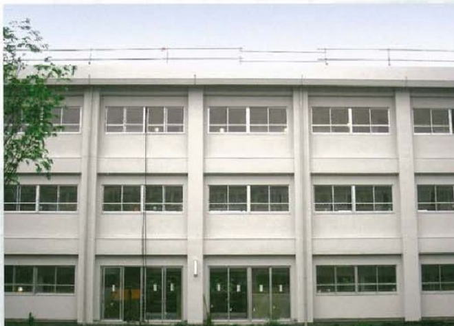
大規模な工事にも対応いたします。