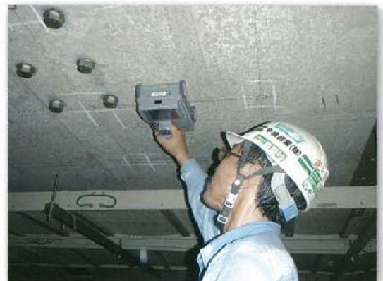
電磁波レーダ 鉄筋探査

当社はこの状況に対応するため、協力関係にあるゼネコンの技術研究所の協力により自社認定資格制度を制定。資格保持者による鉄筋探査を、年間200件以上実施しています。