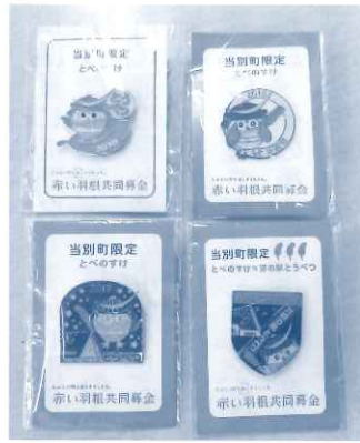
平成27年から30年のバッジ

平成29年にオープンした道の駅や共募事務局等での頒布に加え、各種イベントでPR活動が行われ