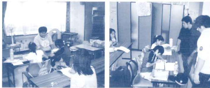
わからなくなると個別に指導 教室は夜間託児所に机を並べて

がったと喜んでくれております。大人の目線ではなく年が近いお兄さんの存在の力のお陰だと感じしております。 これからも、子どもの気持ちに寄り添える塾を心がけていこうと思っております。