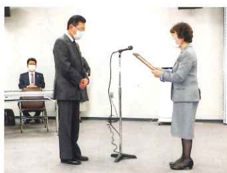
10月27日 感謝状贈呈式 千歳市・北広島市を理事長代読