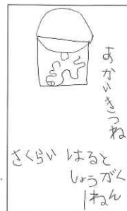
あかいきつね さくし はると しょうがく ねん