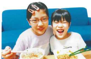
ありがとうございます! いただきま〜す!