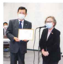
岩見沢市母子寡婦 福祉会