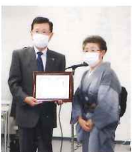
赤平母子寡婦 福祉連合会