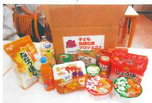
みんなの嬉しいが詰まった 「宝箱」