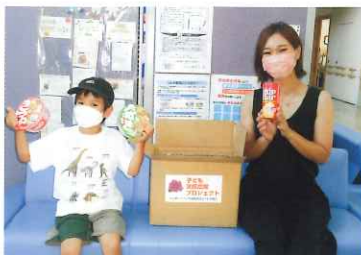
なんてたって「あかいきつね!」