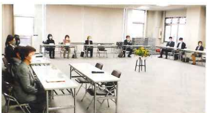
ライオンズクラブの方々と 理事・評議員の懇談会