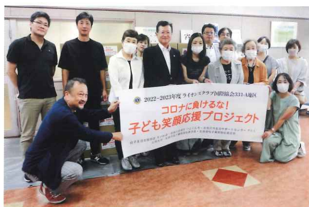
ライオンズクラブの皆さんと記念写真