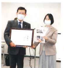
江別市母子会 (こびし会)