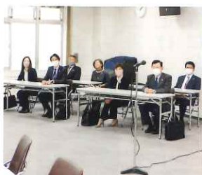
ご臨席のライオンズクラブの方々

長引くコロナで活動や行事の自粛が続く中、嬉しいご支援をいただきました。8月7日と12月4日の2回に亘り、100箱ずつの食糧支援があり、江別市、北広島市、千歳市、当別町、岩見沢市、赤平市、歌志内市の母子会員全家庭に届けられました。物価の高騰が続く中、お米や食用油、レトルトカレーやカップラーメン、お菓子やジュースに、「助かる～!」「こんなに沢山!」「嬉しい～!」と感謝の声が続きました。