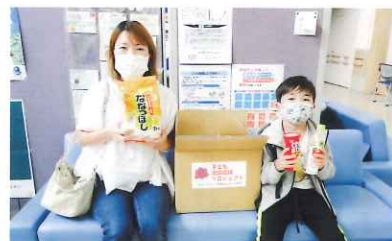
チップスター大好き!

たくさん食べ物頂き、大変感謝しております。 その中で特に食費がからからたのが、大それた 最近 食料量が 増えてきたので、とほほおぼります。 今後 大切に食べていきたいと思っております。 ありがとうございます。