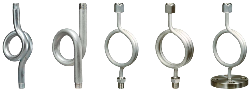
SGP 一般型サイホン SUS304 ソケット付サイホン 2重巻サイホン フランジ付サイホン