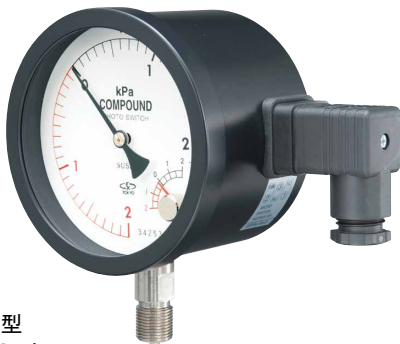
AEP100 型 A2EP100 型