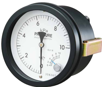
パネル埋込型 Panel mounting DEP75 型 D2EP75 型 DEP100 型 D2EP100 型