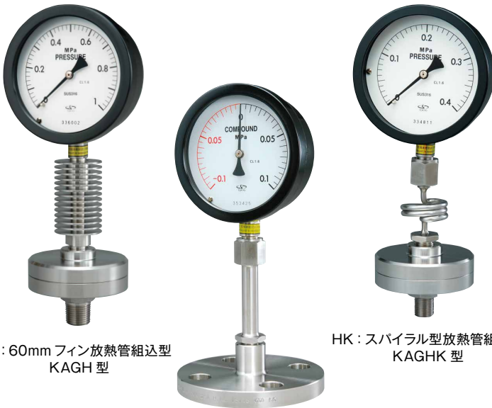
H: 60mmフィン放熱管組込型 KAGH型