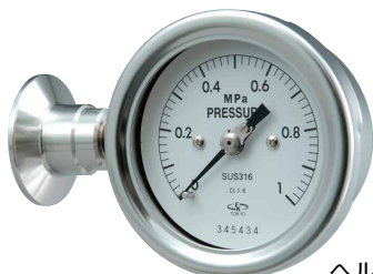
SAC75-9 ヘルール左側面出し型