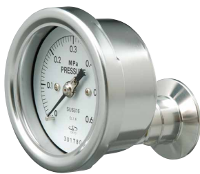
STC 型 STN 型