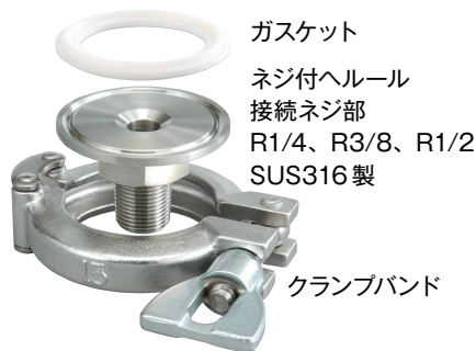
ガスケット ネジ付ヘルール 接続ネジ部 R1/4、R3/8、R1/2 SUS316 製