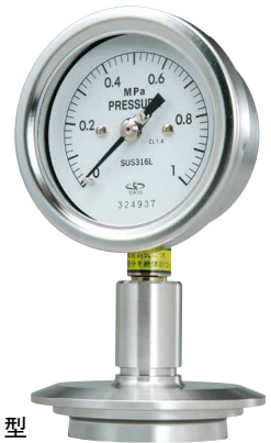
標準立て型 SACSQ75 型、100 型