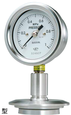
標準立て型 SACSQ75 型、100 型