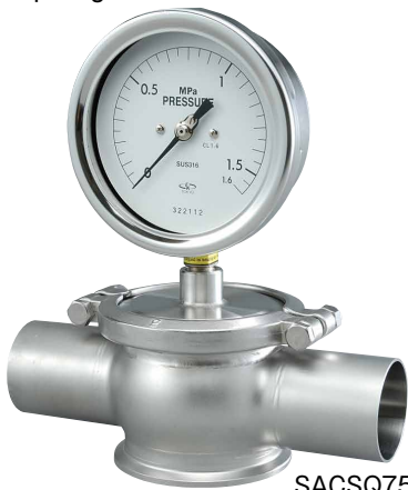
SACSQ75 型 SACSQ100 型