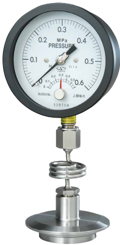
光電スイッチ型 SACHEPSQ75 型、100 型 SUS ケース製もあります。