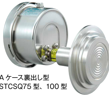
A ケース裏出し型 STCSQ75 型、100 型