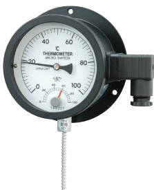
Photo sensor / Micro switch