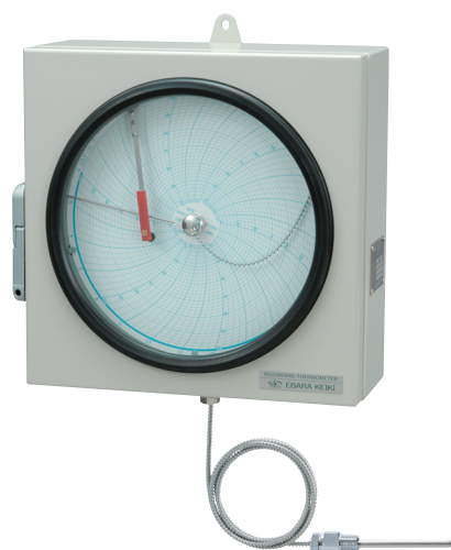
■ 自記温度計 RTHB型 写真は壁掛け型：RTHB1型