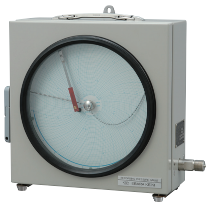
■ 自記圧力計 RPHB型 写真は携帯型：RPHB2型