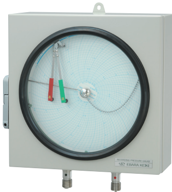
写真は壁掛け型: RWPBH1型