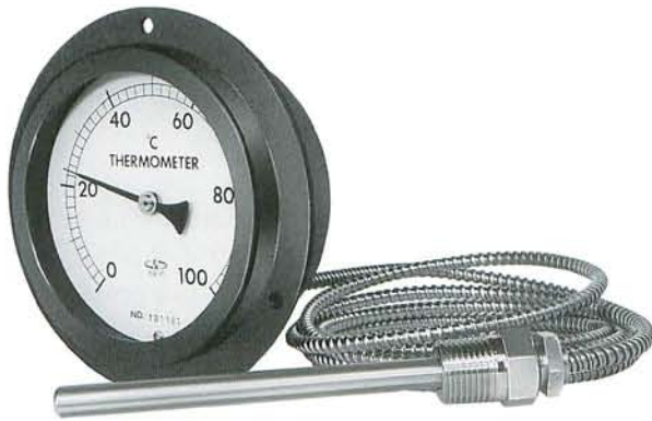
D型(3ヶ所ビス止め式)