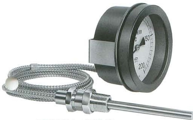
DB型(裏バンド固定式)