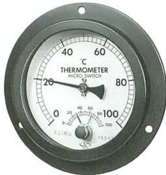
パネル埋込型 D2EM100 (3ヶ所ビス止め式) (写真タイプ)