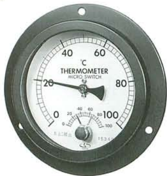
パネル埋込型 D2EM100 (3ヶ所ビス止め式) (写真タイプ)