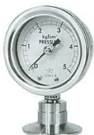
SAC型 ヘルールタイプ