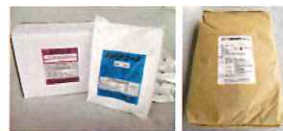
■新パテエース ■基礎補修モルタル