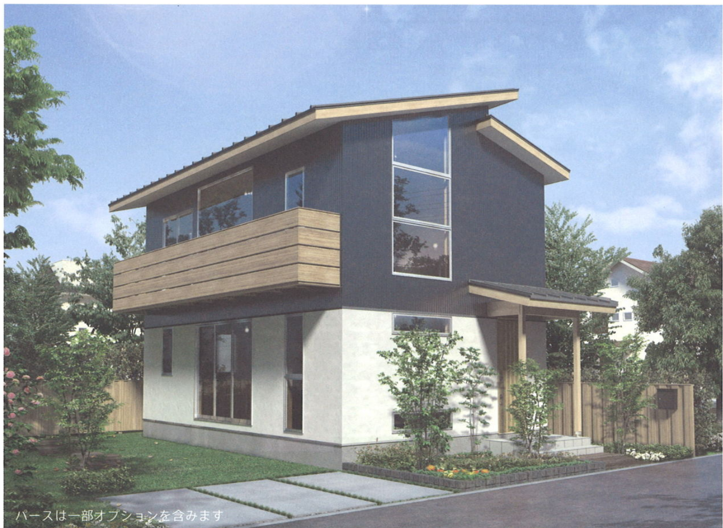
パースは一部オプションを含みます