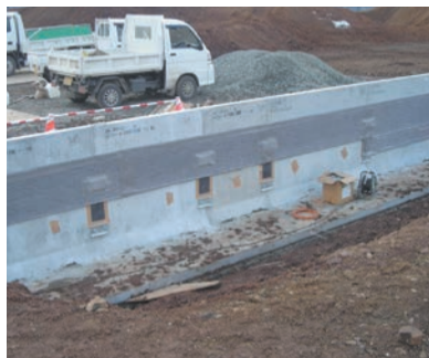
補助フィルター参考取付図