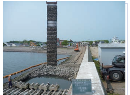
施設 | 急勾配碎石層の構築