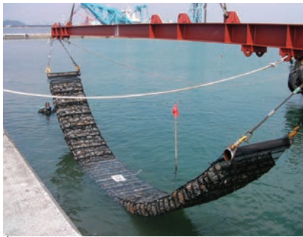
港湾 | 裏込石の侵食防止