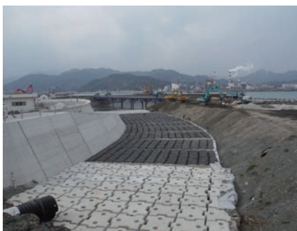
海岸 | 根固め対策