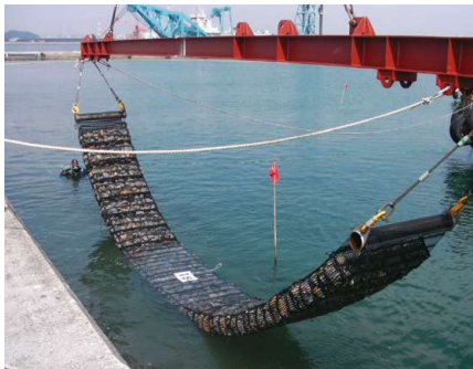
港湾 | 裏込石の浸食防止