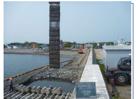
施設 | 急勾配碎石層の構築