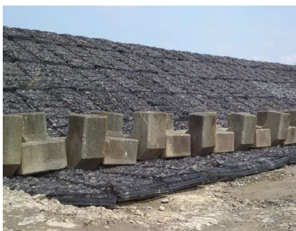
災害復旧 | 決壊堤防の応急対策