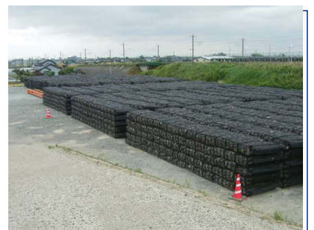
災害復旧 | 災害用備蓄資材