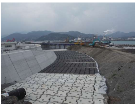
海岸 | 根固め対策