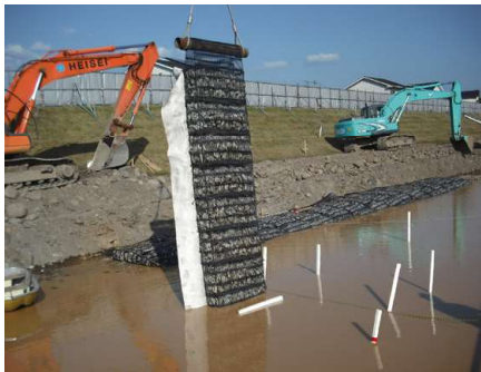
河川 | 堤防の浸食防止