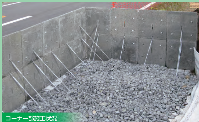
コーナー部施工状況