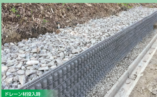
ドレーン材投入時