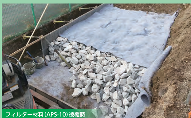
フィルター材料 (APS-10) 被覆時