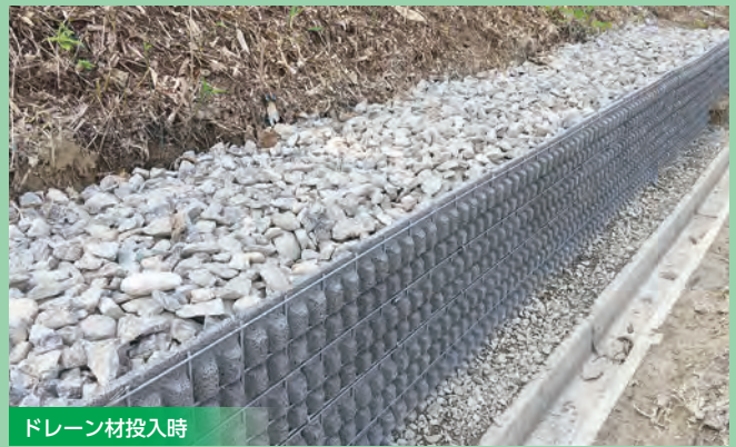
ドレーン材投入時