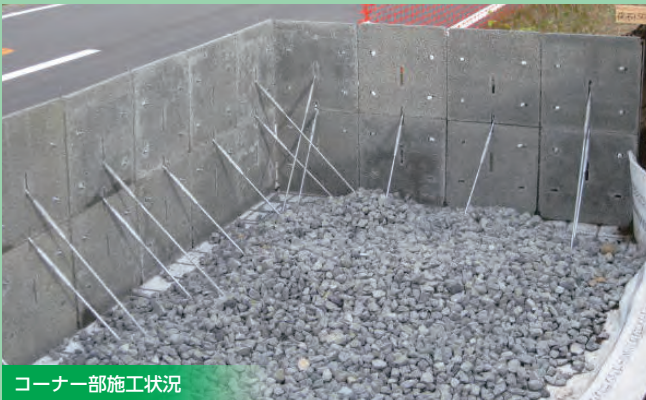
コーナー部施工状況