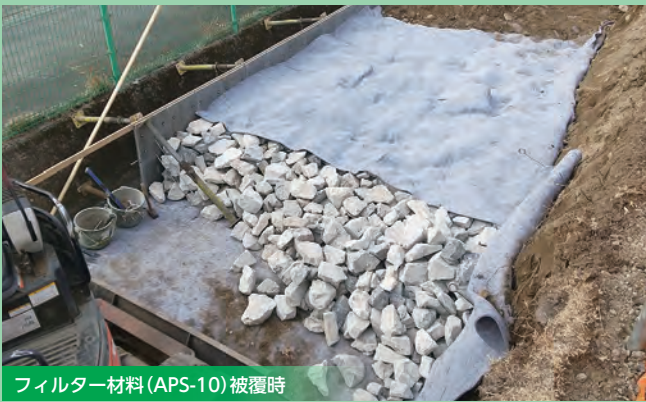
フィルター材料(APS-10)被覆時