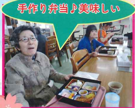
手作り弁当♪美味しい