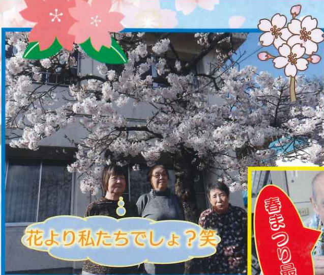
花より私たちでしょ？笑

天気に恵まれた当日、白鳥ホームの桜も満開となりました。手作りの折り詰め弁当に舌鼓を打ち、午後は体育館にて屋台巡りを行いました。屋台はくじ引き、駄菓子、輪投げを準備しており各屋台で皆さんのワクワクした笑顔を見る事が出来ました。 ※体育館の換気、少人数ずつの体育館入場、マスクの着用にご気を付けて行う事ができました。