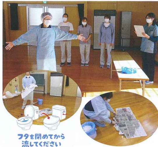
フタを開めてから流してください

吐物処理についての研修会を行いました。冬の時期は特にノロウイルスに警戒が必要です。突然の嘔吐があった際にも、他者への感染を未然に防ぐためにウイルスを拡散させない事が重要となります。ノロウイルスには次亜塩素酸ナトリウム（市販の家庭用塩素系漂白剤濃度約5%）の消毒が有効です。嘔吐以外にも下痢などの症状が出た際はトイレの蓋を閉めて流すなど飛沫感染に注意する事を職員間で確認しました。