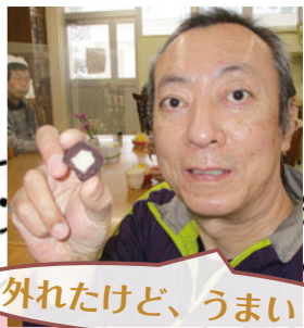
外れたけど、うまい！