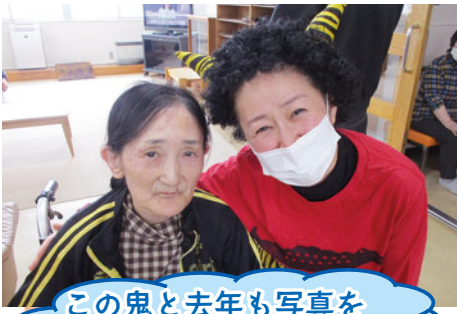
この鬼と去年も写真を 撮った様な気がするな