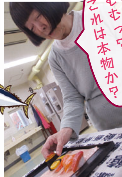
むむっ？ これは本物か？

待ちに待った豪華な寿司を堪能できる日♪ 平内町のお寿司屋さんに腕を振るってもらい、色とりどりの海の食材たちが集合しました。海の恵みに感謝していただきます♪