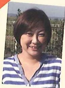
ケアプラン碧の空 ケアマネジャー