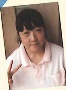
訪問介護碧の風 訪問介護員

今年の夏は北海道へ行ってきました！海の幸♪ラーメン♪そしてビール♪函館ビヤホールで、たっぷり満喫してきました♪中年まっしぐらの今日この頃、ビール腹に気をつけなければ(汗)。