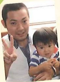
ケアプラン碧の空 ケアマネジャー

1年2ヶ月ぶりに戻ってきました。10年ぶりの赤ちゃんとの生活に四苦八苦(汗)。上の子が小さいママ役♪奮闘してくれて大助かりです。下の子が成人するまで、子育て期間は30年…長いです。