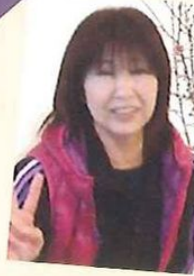
訪問介護碧の風 サービス提供責任者/介護福祉士

健康診断で毎年イエローカードの私。昨年一生懸命ダイエットに励んだにもかかわらず、1年で2kgの減量のみ(汗)。今年の目標は5kg減量すること！自分にきびしくできるかな〜。