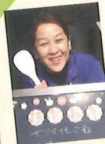
デイサービス碧の郷 調理及び介護助手職員

我が家には二人の息子がいます。今年3歳になる次男は本当にやんちゃで、どこへ行っても「大変ですね」と声をかけられる始末(汗)。そんな弟を溺愛する長男...。母は兄弟仲良くと願っています☆