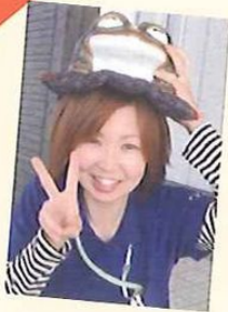
デイサービス碧の郷 介護職員