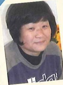
訪問介護碧の風 訪問介護員

2人の息子と娘が1人います。長男は結婚独立。私はおばあちゃん(苦笑)。独身の次男には彼女がいて、出かける時一緒に連れて行ってくれます♪ とんだおじやま虫なのにね(笑)。いつもありがとう。