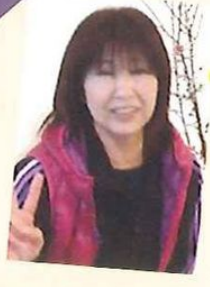
訪問介護碧の風 サービス提供責任者/介護福祉士

健康診断で毎年イエローカードの私。昨年一生懸命ダイエットに励んだにもかかわらず、1年で2kgの減量のみ(汗)。今年の目標は5kg減量すること! 自分にきびしくできるかな~。