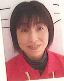
デイサービス碧の郷 介護職員

桜は終わり新緑の頃。春先に花見に行きました。あまりに綺麗で心が洗われ、今後の人生が大きく花咲いていくような…。皆さま、私の人生が花咲くように、ご声援のほどよろしくをお願いしますね！