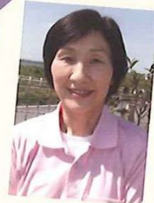
訪問介護碧の風 訪問介護員/介護福祉士

最近ギターを購入しました！高校生になってからギターを始めた娘にうまくのせられて…学生時代以来のギターなので、思ったように指が動かないっ(泣)。目指せ！一曲完成♪