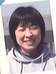
訪問介護碧の風 訪問介護員/介護福祉士

我が家の庭先には、毎日決まった時間にやってくる訪問者が。それは最近流行のブサカワ猫！巨大な体で餌を求めにやってくる！やってくるようになって4か月。住居は今だ不明なままです(汗)。