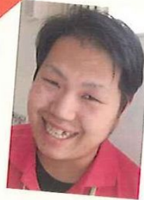
デイサービス碧の郷 介護職員/介護福祉士