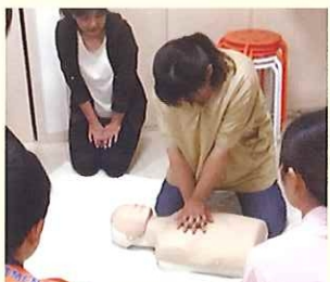
実際に人形を使つての実技

■去る10月2日、神栖消防署の皆さまにおいでいただき、「心配蘇生法」「AEDの使い方」「止血法」「異物除去の実技」についての研修会を開催いたしました!