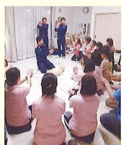
多数スタッフが参加

■事故やケガは起きないことが一番ですが、万が一に備え、日頃から備えは必要です。今回の研修で心構えを持つことができ、いざという時にはきっと役立つことでしょうね☆