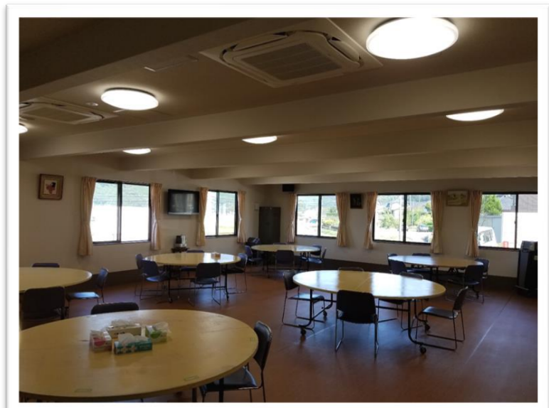
↑ 1階 食堂