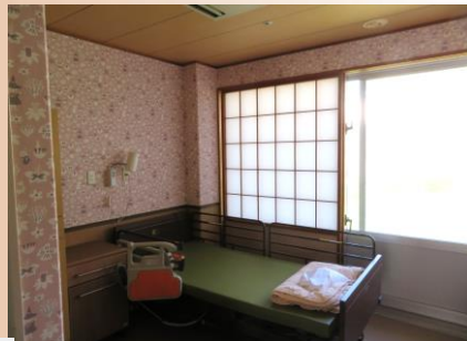
個室（洗面・トイレ付）