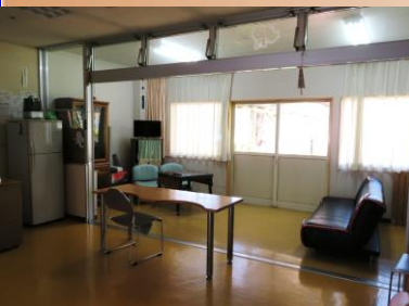
食堂（ショート部位）