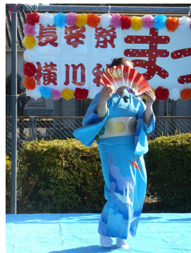
ボランティアの方に踊 りを披露していただき ました →