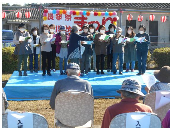
←秋祭りで地域交流・ 地域サロンの皆様の コーラスです