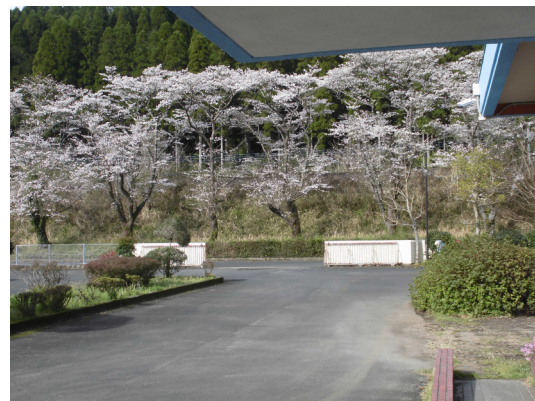
春はさくらが満開でお花見スポットです

当施設は、霧島市横川町にあり緑豊かな環境にあり、敷地が広いところが特徴で、朝夕に敷地内での散歩などで、四季を楽しむことができます。