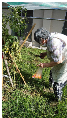
野菜・花・西瓜等の栽培を朝夕に楽しんでます