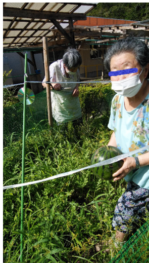
スイカや野菜栽培