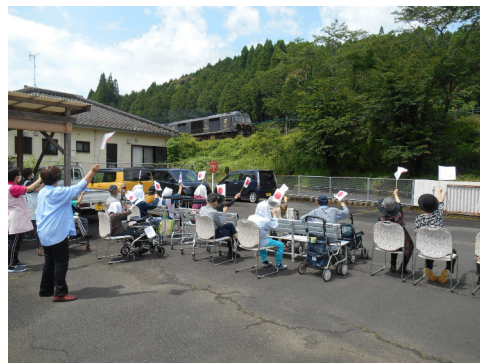
クルーズトレイン ななつ星も見れます