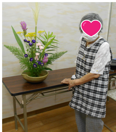
きれいな花を生けました