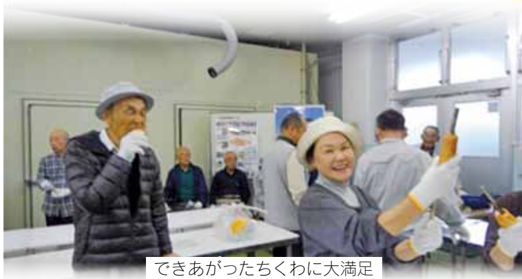
できあがったちくわに大満足

香美町は、日本海に面し、青いきれいな海、海岸は切り立つ岩があり、世界ジオパークに認定されました。その山陰海岸の資源を生かし、香美町では、毎月20日は「魚(とと)の日」と定め、町民が新鮮な魚を食べて健康づくりに役立てることにしています。