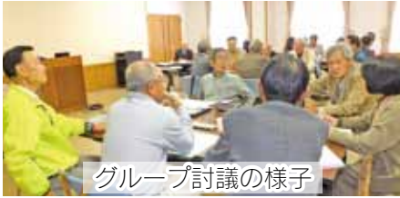
グループ討議の様子

今回で3回目となるSC大阪(大阪府老連)若手委員との交流会が、10月18日に篠山市立四季の森生涯学習センターで行われました。交流会には、SC大阪から12名のじぎくクラブ兵庫からは9名が参加しました。