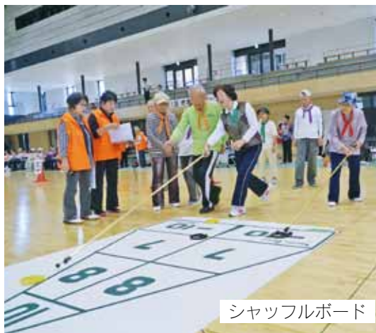
シャッフルボード