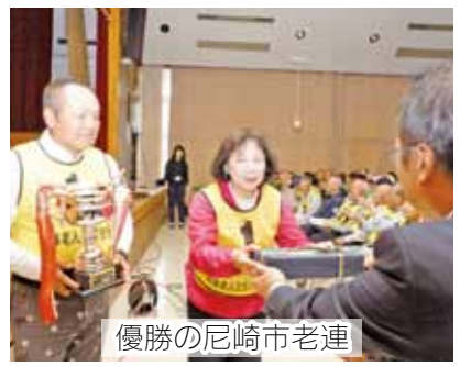
優勝の尼崎市老連

ム5名)215名が選手で参加しました。南あわじ市福良地区公民館をスタート・ゴール地点として、「ちりめんロード」「コースト」「八幡神社」コースに分かれ、コースのコマ図に示されている観察ゾーンや4ヶ所のチェックポイントを回りました。チエツ