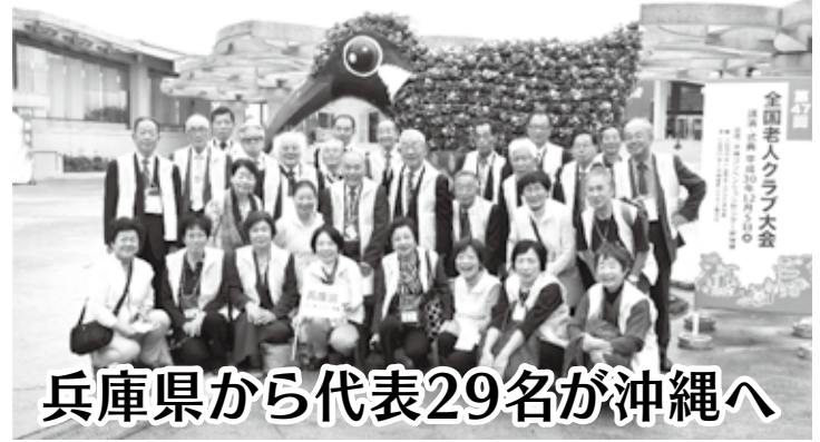
兵庫県から代表29名が沖縄へ

12月4日・5日に、『第47回全国老人クラブ大会』が沖縄県宜野湾市沖繩コンベンションセンター等で、