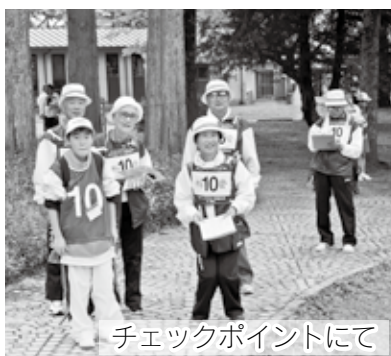
チェックポイントにて

4日、出場する競技会場へ、私たち「いたみスワンウォーカー」5名は緊張の中オープンングセレモニーの後、午前11時にスタート。コマ図を頼りに、約4キロの距離を途中でコースを間違えて元の地点に戻り地図を確認したりしながらも、途中13ヶ所ある観察ゾーンやその地方の問題、ゲーム等を5名で協力しながら結果を解答用紙に記入。他府県のメンバーの後ろを追いかけながらゴールを目指し、2時間強で無事そろってゴールいたしました。