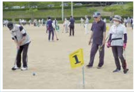
町老連の親睦グラウンドゴルフ大会

令和4年6月24日(金)、神河町「はにおか運動公園」グラウンドにおいて、町老連主催の「親睦グラウンドゴルフ大会」を開催しました。