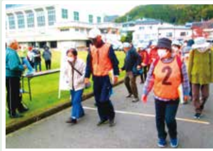
ウォークラリー大会

今年度、町老連の最初の事業であるグラウンドゴルフ大会が開催できたことを契機として、コロナウイルス感染対策に取り組みながら、コロナに負けないとの気概で、更なる事業展開を図りたいと思います。