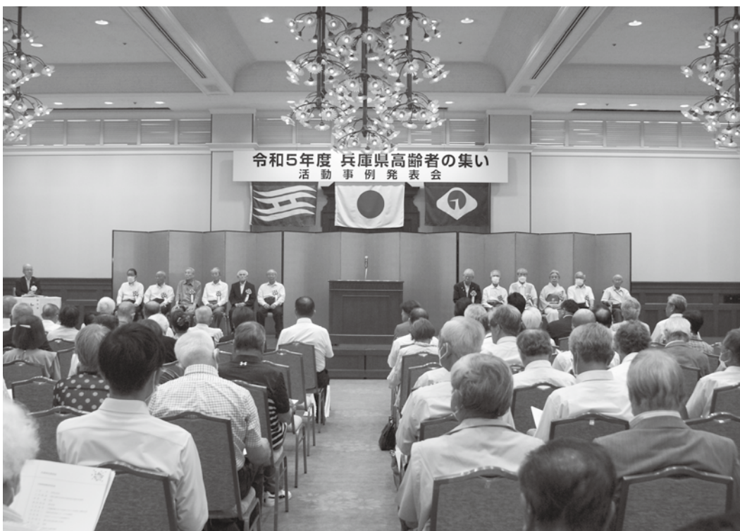
令和5年度 兵庫県高齢者の集い 活動事例発表会