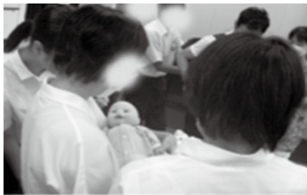
※自立支援セミナー 「性といのち」を受講する子どもたち