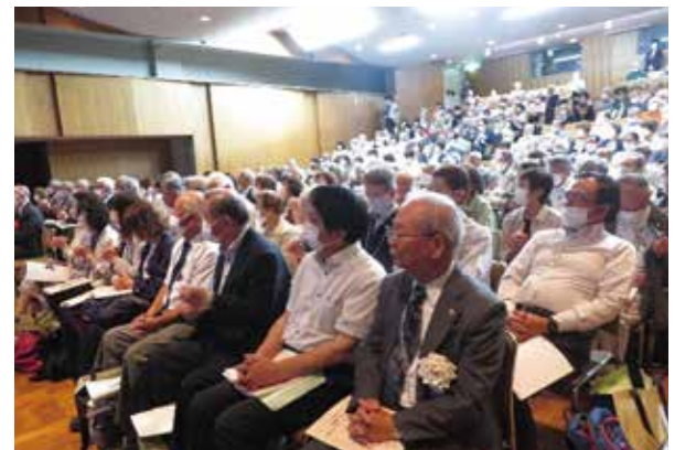
真剣に聞き入る参加者の皆さん