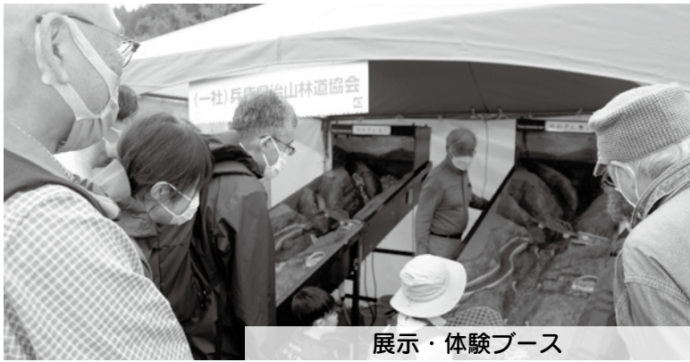
展示・体験ブース

また、里山をテーマとした様々な展示・体験ブースや、ジビエ料理などを提供する飲食ブースが出展予定です。是非、姫路城が一望できる本イベント会場へお越し下さい。入場料は無料です。 [治山課]