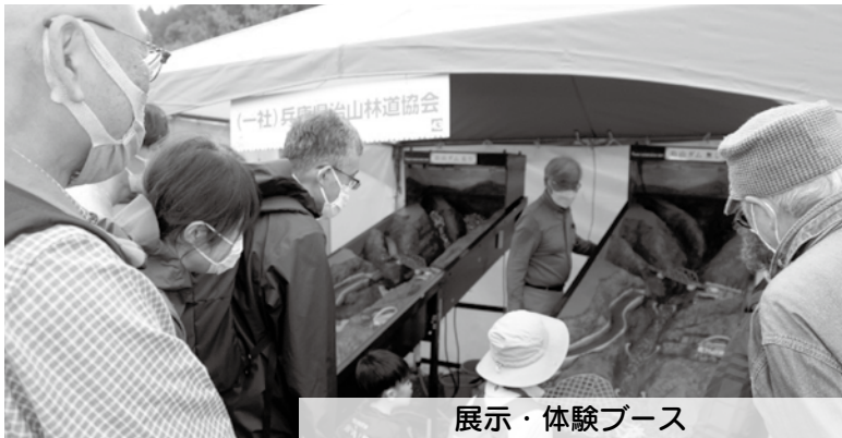
展示・体験ブース

また、里山をテーマとした様々な展示・体験ブースや、ジビエ料理などを提供する飲食ブースが出展予定です。是非、姫路城が一望できる本イベント会場へお越し下さい。入場料は無料です。 [治山課]