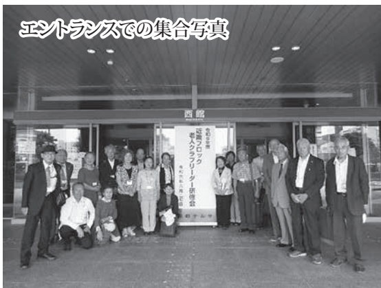
イベントスペースでの集合写真

主催 全国老人クラブ連合会、近畿老人クラブ連絡協議会、京都府老人クラブ連合会 後援 京都市、京都府、京都府社会福祉協議会、京都府社会福祉協議会