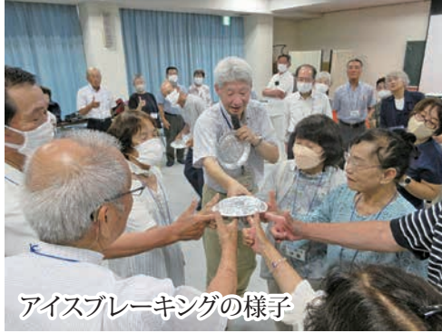
アイスブレイキングの様子