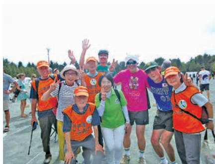
海外のチームとの交歓