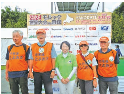
県老連派遣チーム

いつも、『明るく・元気で・笑顔いっぱい』をモットーに、会員の皆様が、心から、楽しんで日々を過ごすことができますように、これからも精一杯取り組んで参ります。