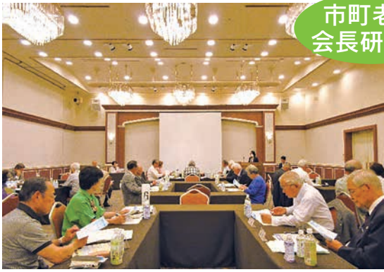
市町老連 会長研修会