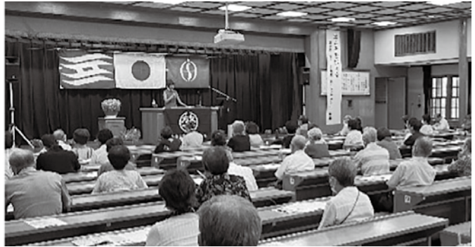
いなみ野学園（加古川市）での講義風景

(公財)兵庫県生きがい創造協会では、生きがいのある充実した生活を営むための学習の場として、高齢者大学等を開設しています。