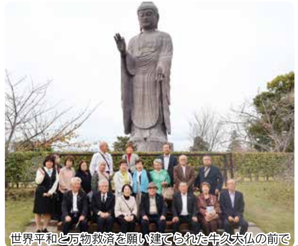
世界平和と万物救済を願い建てられた牛久大仏の前で