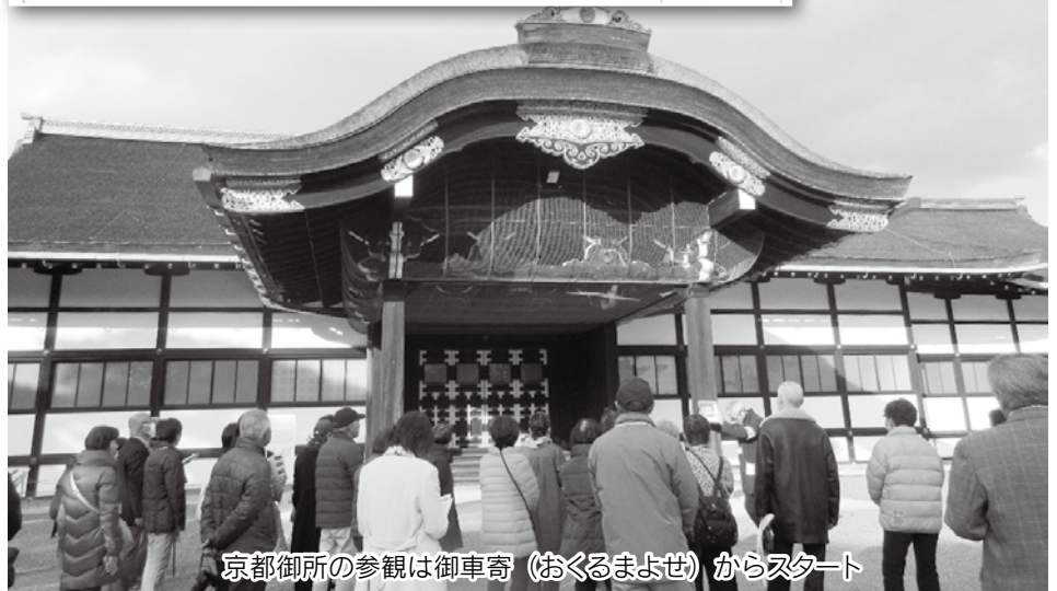
京都御所の参観は御車寄(おくるまよせ)からスタート

令和7年12月11日(木)、6回目を迎える兵庫県老連と京都府老連の交流会を実施しました。 交流会には、兵庫県老連及び京都府老連から11名ずつの合計22名が参加しました。