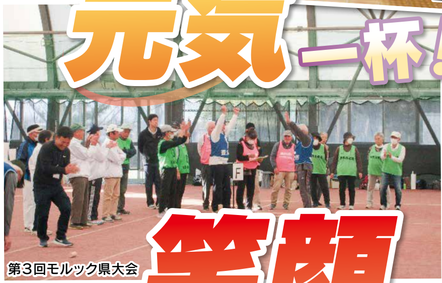
第3回モルツク県大会