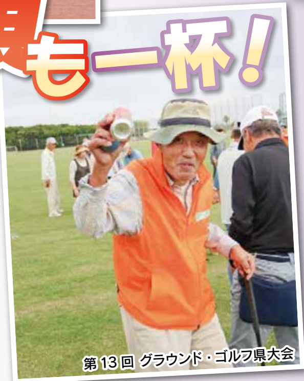
第13回 グラウンド・ゴルフ県大会