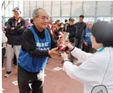
優勝された 岸田すこやかクラブ