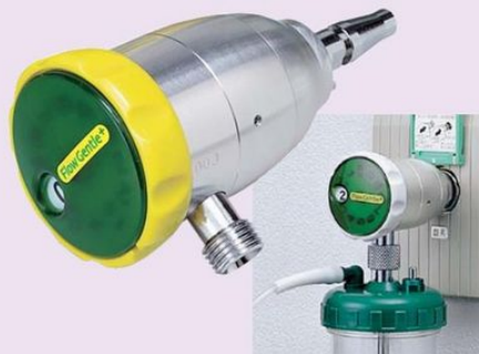
院内アウトレット装着例